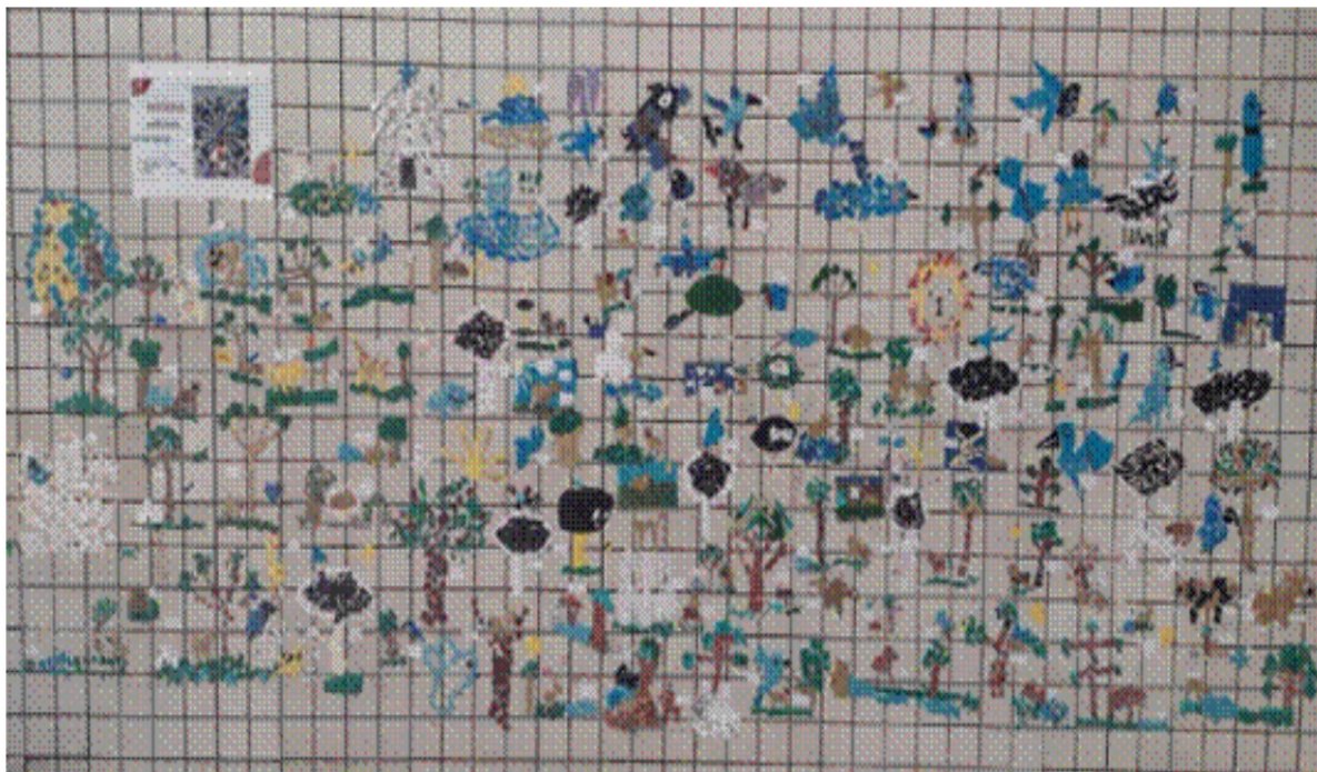
Mural em mosaico coletivo produzido pelos estudantes do 3º ano (COLÉGIO MEDIANEIRA, 2026)

mentos de papel. Primeiro produzem individualmente e finalizam de forma coletiva, montando um mural inspirado em obras urbanas de Curitiba.