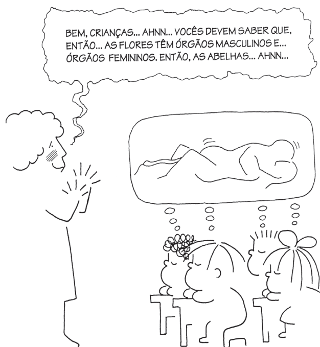
(1977) Educação sexual (1)

Mas as novas exigências que se fazem à professora não se restringem a aplicações da teoria piagetiana à escola: assim, a conveniência de aulas de educação sexual faz parte da agenda dos mestres atuais, e isso é ilustrado pelo cartum da Figura 5. Evidentemente perturbada – o rubor