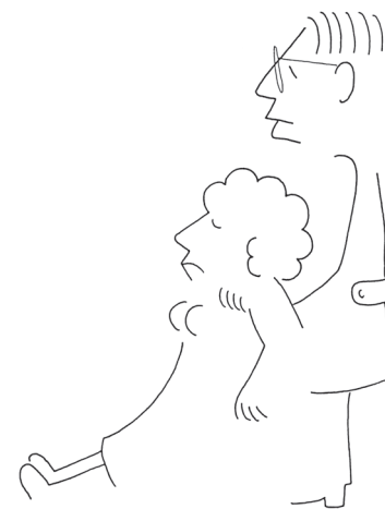
76) É necessário auxiliar o professor

Mas mais previsível do que a necessidade de ajuda de um agente de saúde numa ocasião de desmaio, é a chegada das férias escolares. Na seqüência de desenhos (Figura 8) do autor italiano, a despedida chorosa (autêntica? encenada?) do