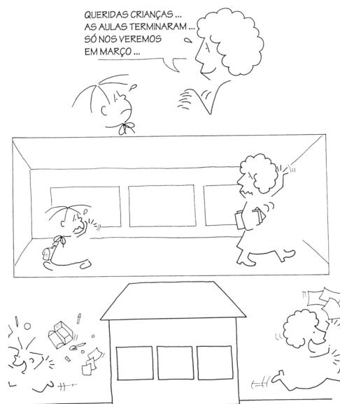
(1980) Tchau, escola!