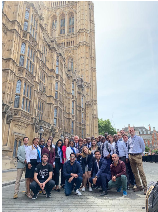
Turma de Julho de 2019

Solicite seu Application aos professores: